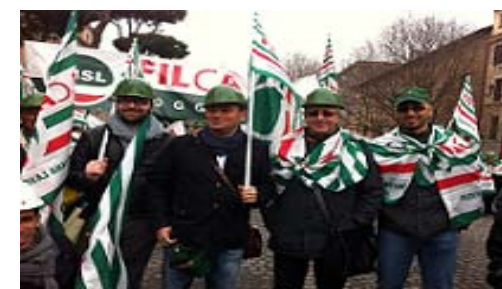
IL SINDACATO FILCA CISL PARMA E PIACENZA A CONGRESSO